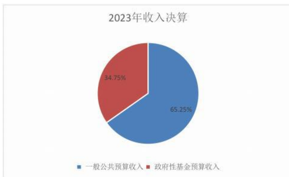
图 1. 收入决算图